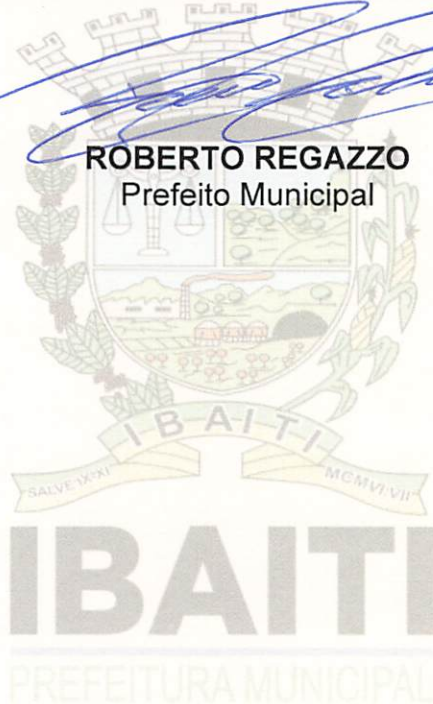
ROBERTO REGAZZO Prefeito Municipal

GABINETE DO PREFEITO MUNICIPAL DE IBAITI, ESTADO DO PARANÁ , aos cinco dias do mês de maio do ano de dois mil e vinte e cinco. (05/05/2025).